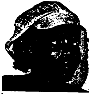
É isso aí. Mais uma vez o Milton Nascimento, pinta aqui na Coluna.

A culpa é dele. Quem manda ser bom, ser notícia todas as semanas nas revistas especializadas, ser manchete e ter a música no sangue. O cantor vem vendendo o seu GERAES prá mais de 250 mil cópias, extrapolando as expectativas da ODEON, pois o Milton é classe A. Porém, todo mundo está gostando do seu disco, daí o sucesso de vendagem e de execução. Em Sergipe, diariamente as suas músicas são executadas pelas emissoras, que não fazem mais do que a obrigação, pois demonstram o bom gosto dos seus discotecários e o atendimento aos apelos do público.