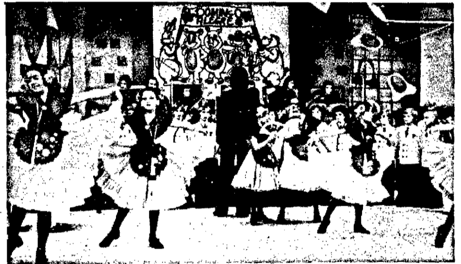
Os pequenos (grandes) cantores do Colégio Anchieta do Rio Grande do Sul, com as homenagens da nossa gente, pela beleza que apresentam.