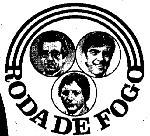
Eduardo - Rolando Boldrin Bento - Francisco Milani Edmundo - Fulvio Stefanini