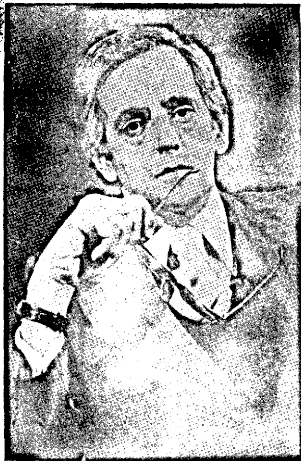
A NOVA "FERA" DA TELEVISÃO BRASILEIRA: FLÁVIO CAVALCANTI, O CRIADOR DE CASOS.