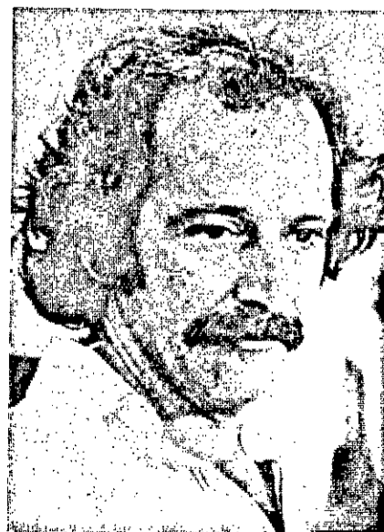
ASTRO CLAUDIO MARDO, quem se trata? Tapa de televisão para mais uma temporada de sucessos.