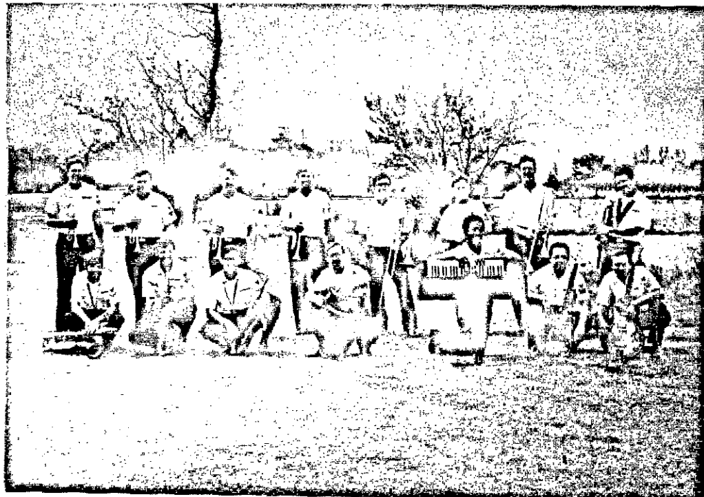
2. THE UNITED STATES ATLANTIC FLEET BAND com apresentação marcada para o dia 15 em nossa Capital.

INDÚSTRIA DE MÓVEIS SÃO JOSÉ Móveis em todos os estilos; do modelo colonial ao moderno mais sofisticado, além de restaurações em geral e empalhamento de cadeiras. AV. CHANCELER OSVALDO ARANHA 151/7 (BR-101) FONE: 3556.