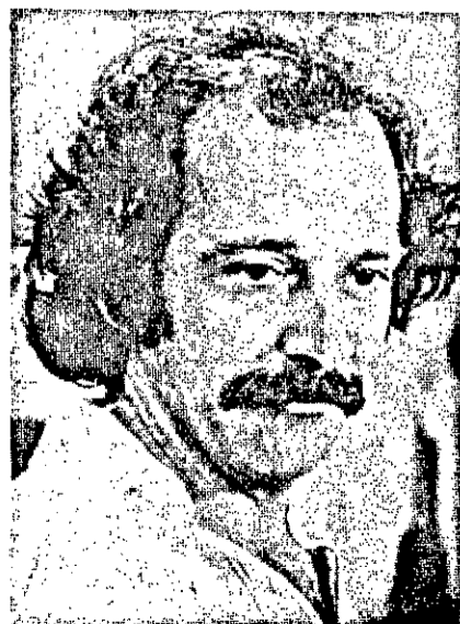
O ASTRO CLAUDIO MARZ, quem no Bô Tupi de Televisão para mais uma temporada de sucessos.