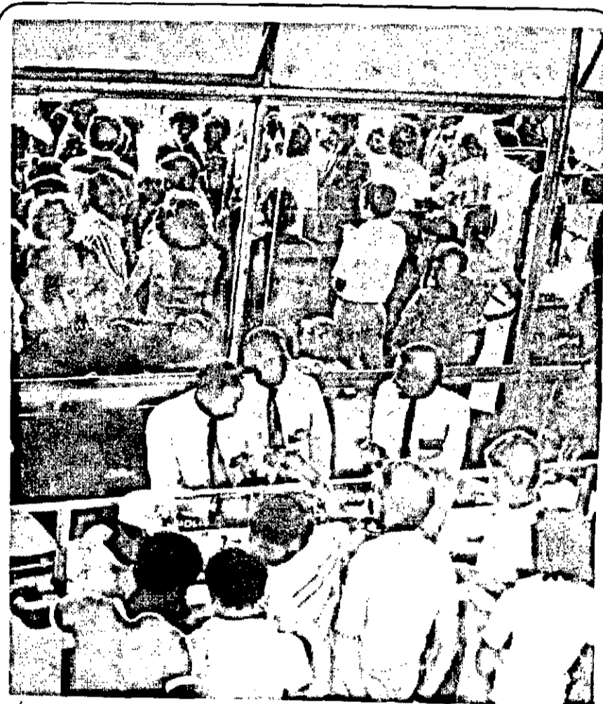
Era muito grande ontem o movimento na Estação Rodoviária. Muitos passageiros viajando para o interior onde votam hoje. O movimento maior era para Lagarto, Itabaiana, Propriá, Glória e Tobias Barreto. Também muita gente viajando para Salvador e outros chegando dali para Aracaju.

A chamada "oposição oligárquica", sem voto popular usou a última arma na qual de fato acredita: o dinheiro. (Leia na última página contra a carestia, uma bolsa vazia.)