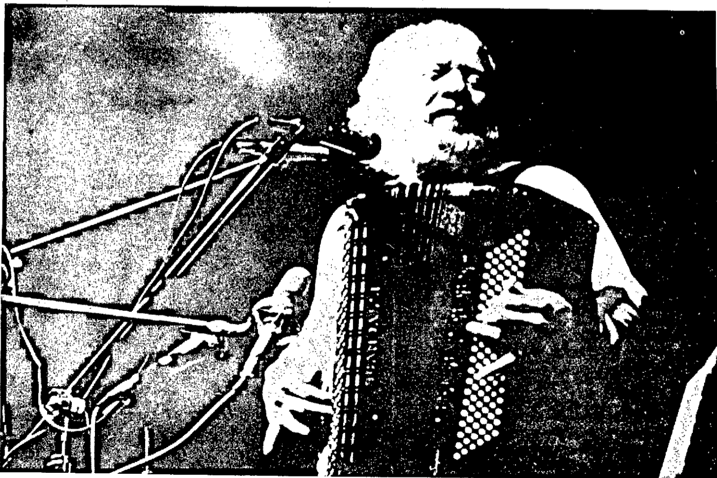
SIVUCA, será grande atração no Teatro do Atheneu nos dias 22 e 23 de novembro, em sensacional apresentação.

Como bom nordestino SIVUCA jamais deixou a sua simplicidade ser afetada pelos cinco anos de Europa e 13 de United States of America. Conserva sua origem musical acrescida de tantas experiências nos palcos do mundo inteiro, além de 2 anos de estudos sobre a música africana.