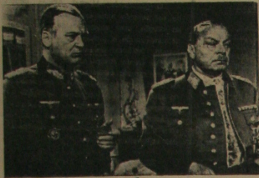
CURD JURGENS & PAUL HARTMANN: "O MAIS LONGO DOS DIAS"

SÃO numerosos, e até bons, os lançamentos cinematográficos desta semana, em nossa Capital. Vão desfilor: "O Homem que Sabia Demais", "Morte à Ferá", "O Mais Longo dos Dias" e "O Capitão do Rei". Os dois primeiros são os melhores. Não importa a quem "The Longest Day" seja superprodução — e por isso é que vai ter mais atração perante o grande público.