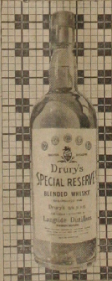
Bom mesmo é DRURY'S com água de côco.

O "Moleque Travesso" nesta sua atual temporada em gramados sergipanos já realizou três jogos. Venceu o Cruzeiro de Simão Dias (3 x 1 e 5 x 3) e o Vasco por 1 x 0, numa peleja em que não convenceu a torcida aracajuana. Esta noite em nossa principal praça de