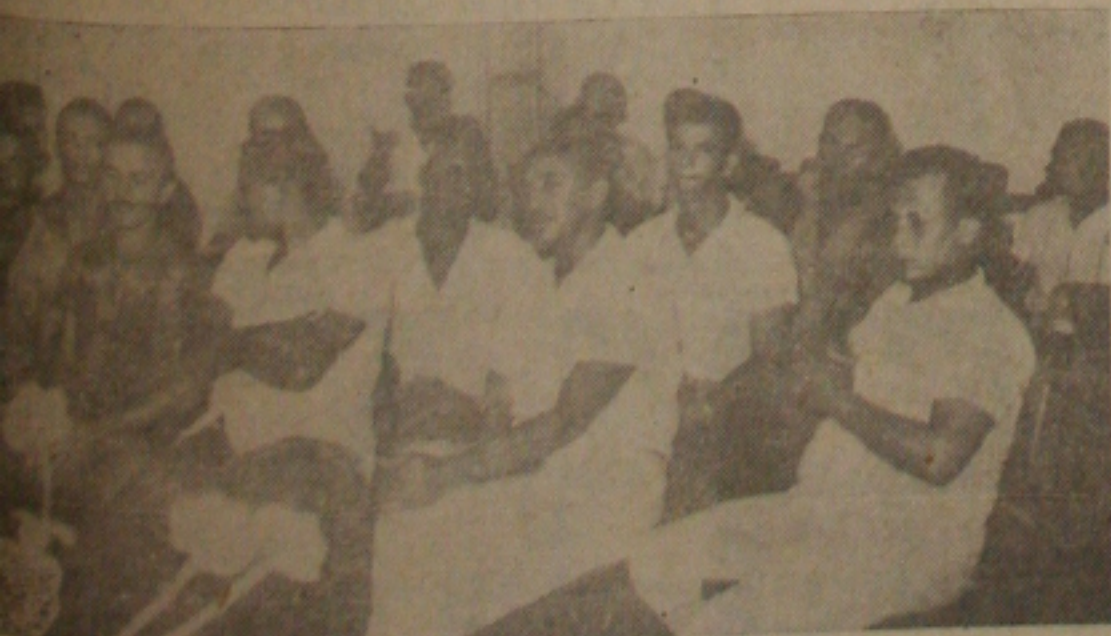
Assuntão que não houve

ESTUDANTES de Capital, apesar de marcado uma reu- nião para a noite de on- te com os proprietários ônibus para estuda-