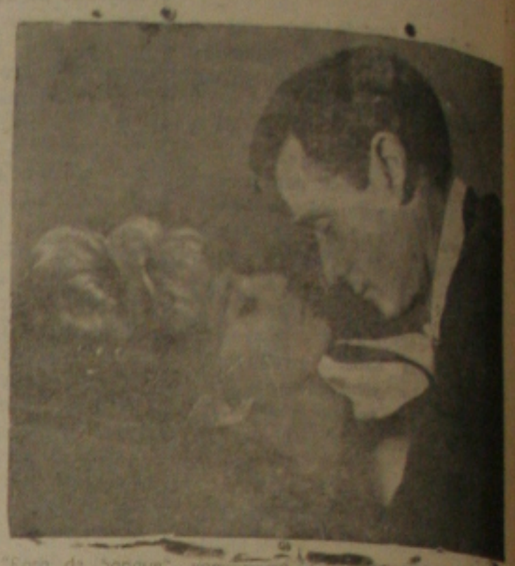
"Fama de sangue", vampirismo de sucesso, com Mel Ferrer e Aurette Stroyberg, é o lançamento aguardado do Palácio.