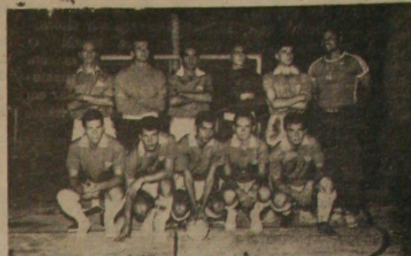
A representação Iate que esta noite vai ao encontro da reabilitação

Tendo os "handi-caps" de campo e torcida dos "galegos da prala" tentarão a desforra da derrota que infôra imposta pelo River, sábado passado. Por outro lado, a AABB, que foi fragorosamente goleada pelo Cotinguiba, tem o mesmo desejo, o qual torna-se difícil não somente pela fragillade do seu quinteto, como ainda pela maior categoria do adversário que poderá baquear tendo em vistas as surpresas sempre constantes na vida, mas que por outro prisma é o franco favorito.