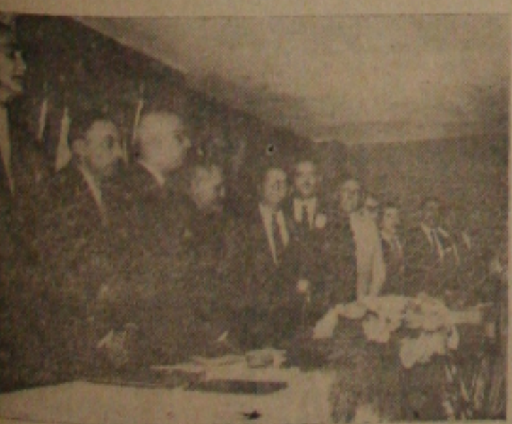
Aspecto da instalação da VII Conferência Distrital do Rotary

fez brilhante discurso, onde frisou que "não há melhor regime que o democrático". "Ainda está por inventar", disse o governador baiano, outro sistema político que proteja mais a liberdade. Mas, estaríamos dando um atestado de cegueira se desconhecemos que a a democracia, praticada incompletamente no Brasil, tem permitido a perpetuação de injustiças, que constituem a negação de muitos dos seus postulados fundamentais".