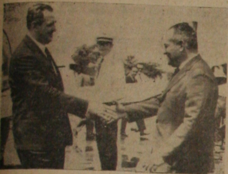
Governador Celso de Carvalho cumprimenta Lomanto Junior quando do seu desembarque

O GOVERNADOR Lomanto Junior, do Estado da Bahia, que aqui se encontra em caráter particular, participando da VII Conferencia Distrital do Rotary, concedeu no dia de ontem entrevista exclusiva a reportagem GS, na qual define sua posição de governante progressista, voltado para as aspirações do povo brasileiro, constanciada nas reformas de base.