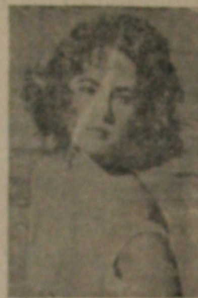
LIZ & BURTON MONTREAL 16 — Em