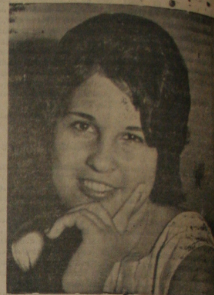
Este jovem que vive...