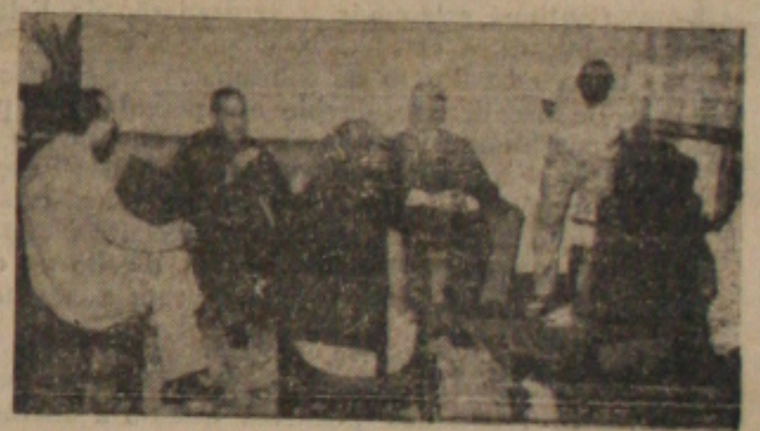
Pediatras solidarizam-se com D. Távora

Neste documento os pediatras ressaltam não poder