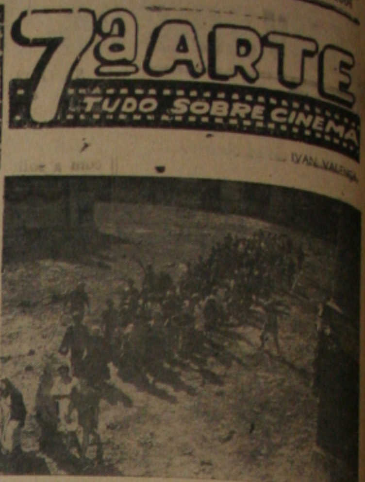
Enquanto a sucata "Jesus, o filho de Deus" não dá show de bilheteria

PALACE QUO VADIS, em technicolor, com Robert Taylor e Deborah Kerr. Livre RIO BRANCO ESCRAVAS DO MEDO com Glenn Ford, Lee Remick. 10 anos VITORIA PAO. AMOR E ANDA. LUZIA, em technicolor com Carmen Sevilla. Livre. BANCO FREIRE SILVEIRA ASSEMBLEIA GERAL ORDINARIA São convidados os senhores acionistas a reunirem-se em Assembléia Geral Ordinária, no proximo dia 6 de abril, as 9 horas, na sede social a rua João Pessoa, 162, nesta cidade, a fim de tomarem conhecimento e deliberarem sobre o seguinte: