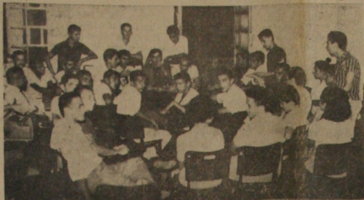
Estudantes reunidos no Sindicato dos Bancários

Em Assembléa Geral na noite de ontem, os estudantes aprovaram uma moção de solidariedade à GAZETA DE SERGIPE, que foi atacada por dar cobertura a greve estudantil, em um programa radiofônico.