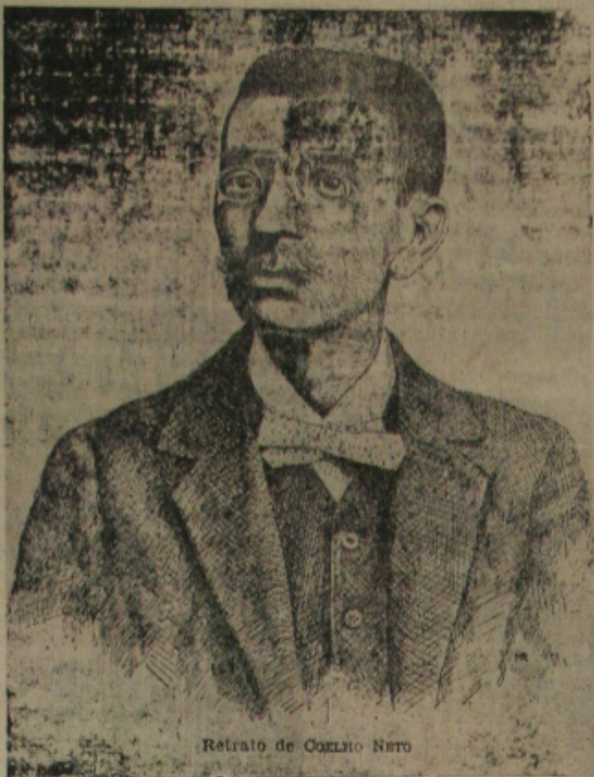
Retrato de Coelho Neto

Coelho Neto, é necessário que se diga, foi um dos fundadores da Academia Brasileira de Letras, crian-