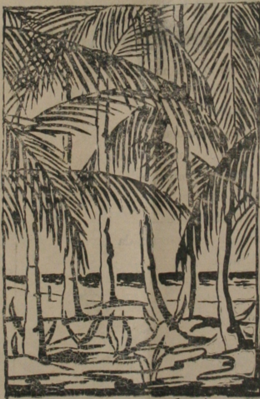
Flora / 2017