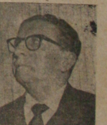
Ademar de Barros

São Paulo, 2 — Discursando diretamente do Palácio dos Campos Elísios, o governador de São Paulo, senhor Ademar de Barros, declarou que apesar de vitoriosa a revolução há um clima de desconfiança. Nesta afirmação disse o governador paulista que "o Poder de Brasília havia sido dado, principalmente por São Paulo que está vigilante e, se continuar essa desconfiança, São Paulo prosseguirá na luta". Mais adiante disse Ademar que "São Paulo ainda não depôs as armas".