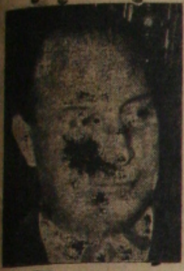
Presidente Ranieri Mazzili

BRASÍLIA. — O Presidente do Senado, sr. Ranieri Mazzili, já está em pleno exercício do cargo de Chefe do Executivo brasileiro, tendo nomeado na noite de hoje alguns Ministros de Estado, além dos Chefes das Casas Civil e Militar e o Prefeito de Brasília.