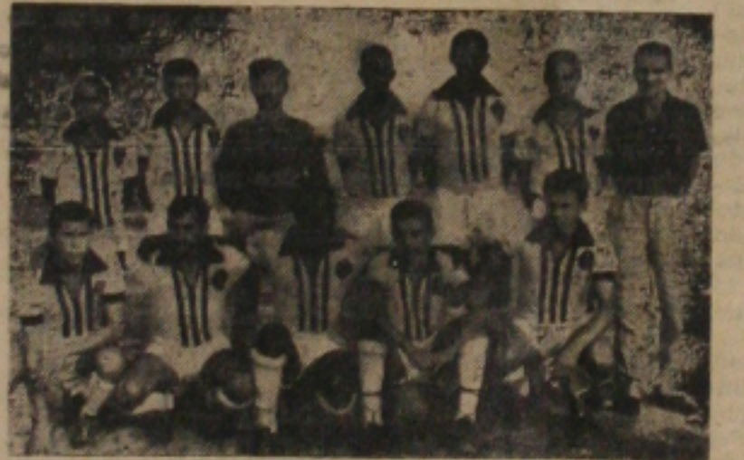
Quadro do Lagartense, que no ultimo domingo derrotou os Amadores do Sergipe pelo score minimo

Recebemos do presidente da FFSFS, dr. Lello Fortes a tabela da fase final da III Copa Gazeta de Sergipe. A tabela ficou assim organizada: Abril sem data — A. Atletica x Cottingulba — River Plate x Iate — Quadra do Iate — 7 — Cottingulba x Iate — A. A. S. x Olimpico — Quadra da A. A. S. — 11 — Cottingulba x River — Iate x A. A. S. — Quadra do Iate