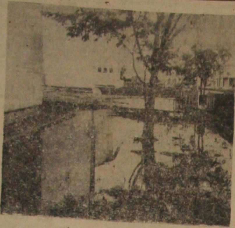
Aguas, águas, águas...