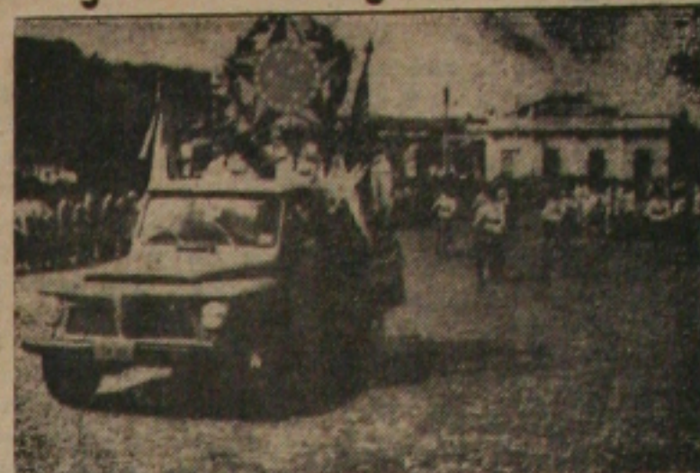
Carro alegórico do Salesiano

O desfile, que começou com meia hora de atraso (às 9.30), foi assistido por uma verdadeira multidão que não se cansava de aplaudir os estudantes de nossa terra. Grande parte dos colégios e ginásios de nossa Capital participaram do desfile e da concentração na Fausto Cardoso.