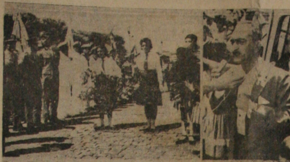
Corbeille para as Forças Armadas

Na oportunidade, quando se comemorava também o terceiro aniversário de fundação da Capital da República, Brasília, os Colégios fizeram particular homenagem às forças armadas, oferecendo às representações do Exército, Marinha e Aeronáutica uma orbeille de flores.