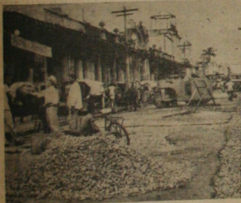
Serviços parados na José do Prado Franco