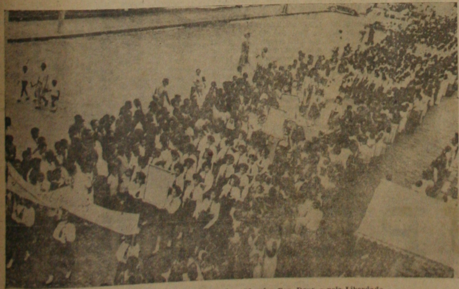
Estudantes desfilam, povo aprecia: Marcha Por Deus e pela Liberdade

ARACAJU teve no último domingo, a sua "Marcha da Família Por Deus e Pela Liberdade", nos moldes da que outros Estados vem encetando. Reunindo a massa social local, grande foi o número de pessoas que