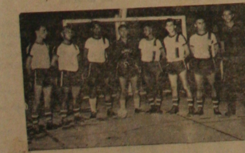
Após vencer do River, o Olímpico deu grande reviravolta na III Copa Gazeta.

de Basquetebol está funcionando. Desta feita o treinamento será da turma feminina e pelo manhã. frentando ao Cortinguilbo. Os 21 minutos contra o late são serão complementados na próxima semana.