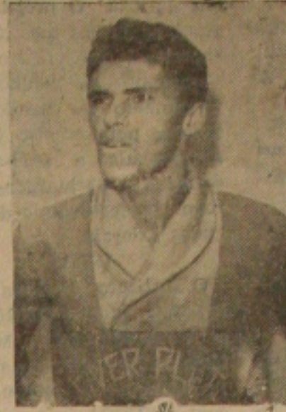
VALDEMIR — Lateal platino, que hoje enfrentará o late, pensando no título.

O último campeão, o River, estará tentando levar de vencido seu adversário, pensando na conquista da Copa Gazeta, evidente, quelmando as pretensões lateanas. O quadro pla-