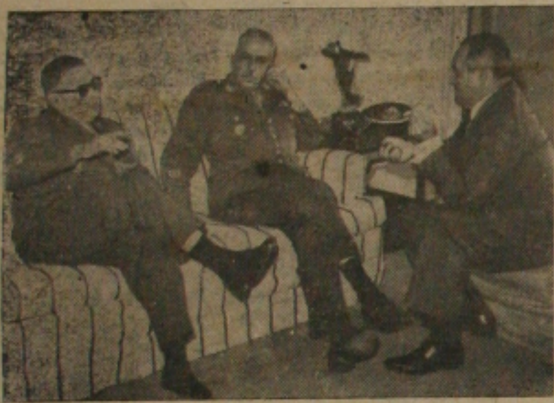
General Mendes Pereira e o Governador Celso de Carvalho

"NÃO HA influência de qualquer partido político na ação do Comando da VI Região Militar. Nosso unico partido é o Partido do Brasil. Achamos que todas as agremiações são dignas, tem homens de valor e não fazemos distinção entre elas, todas serão tratadas com igualdade.