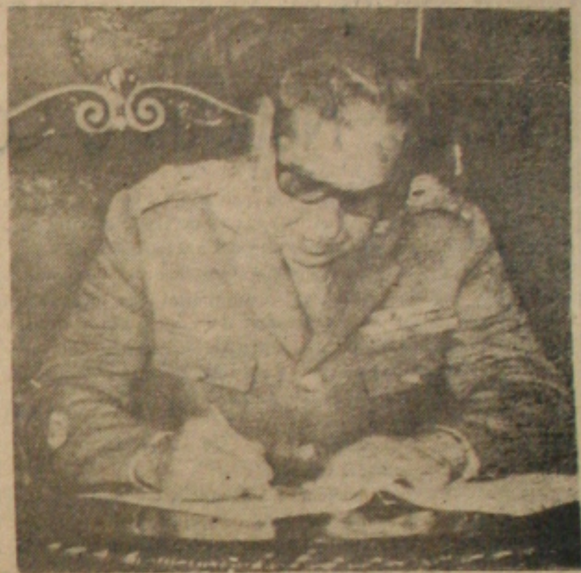
General Artur Costa e Silva Ministro da Guerra

Essa revolução democrática que é a consolidação histórica dos movimentos civis de julho de 22 e 24, de 30, 32, e 45, nasceu em todos os lares bem formados da nacionalidade, e nêles, foi alimentada pelas aspirações mais autênticas do nosso povo. São aspirações que vem desde o tempo colonial, quando o facho da liberdade já era aceso em Minas Gerais pelo idealismo dos Inconfidentes.