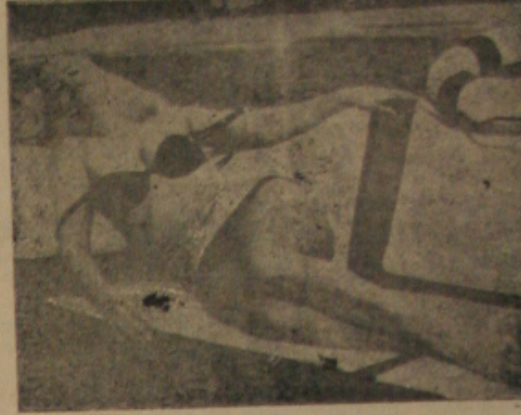
A SERENA beleza de Libertad em um tanto de plácida serenidade. Libertad é também Lablanc, aquela estrela de "Nua e Acossada" centemente exibida. Muito bonita, muito. Libertad visitou também recentemente e Guarara e de lá levou boas impressões. Melhores mos nós. Como essa da foto. Uma bela para uma mais bela mulher: Libertad Lablanc.

Espera-se que em meados de junho, caso cessem as fortes chuvas que têm caído, espera-se que as estradas voltem a ter um tráfego normal. No sentido do melhoramento total das rodovias, providências junto às autoridades federais, especialmente à Sudene, estão sendo entabuladas pelo governo do Estado.