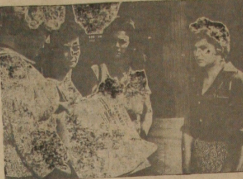
"ADUA E SUAS COMPANHEIRAS"