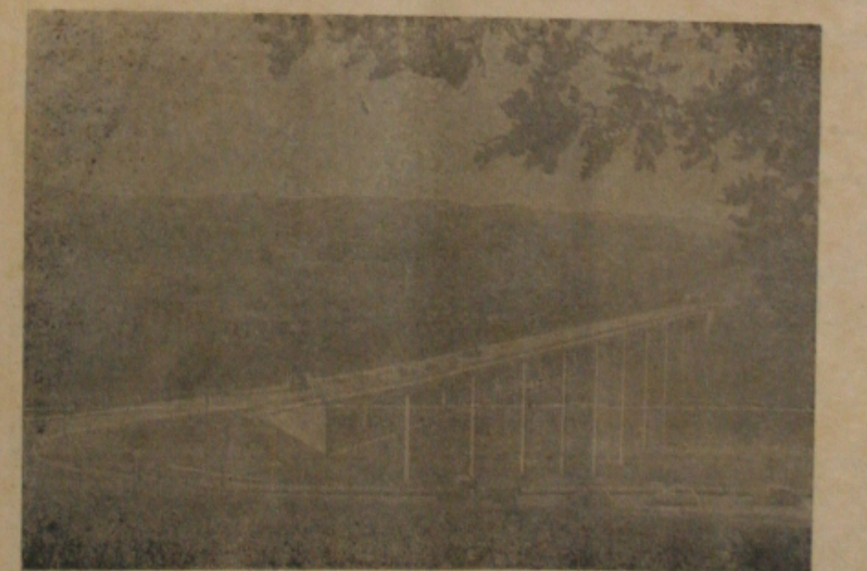
A represa do vale Bigge, uma das maiores na República Federal Alemã, que acarretou a mudança de todo um povoado, tem capacidade para 140 milhões de metros cúbicos de água, será inaugurada este mês na Alemanha. A represa será cruzada por quatro pontes, duas das quais de dois andares. (foto).