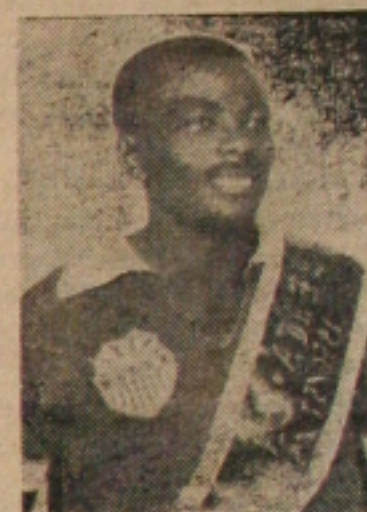
ABC — o goleador santacruzense que espera na próxima domingo retornar a Estância com uma vitória.

Na Princesa do Piauítinga o penta-campeão, sem muito alarde, vem treinando com assiduidade, esperando dobrar seu perigoso oponente, mesmo sabendo o perigo que o mesmo representa em qualquer oportunidade. O Olímpico, na