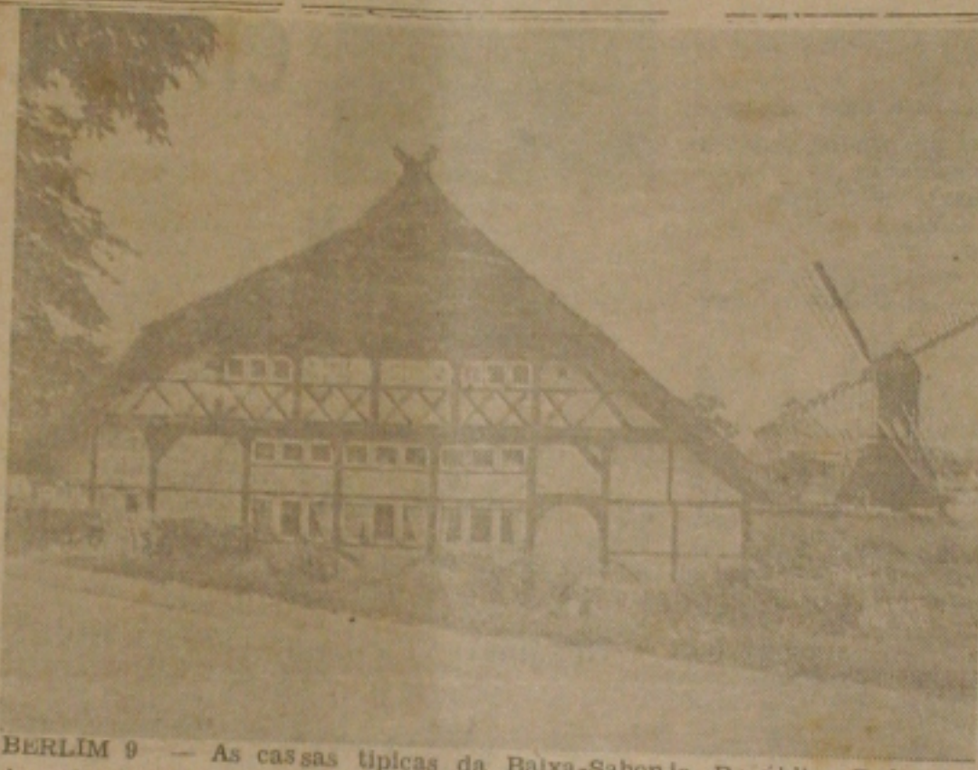
BERLIM 9 — As casas típicas da Baixa-Sabonia, República Federal da Alemanha (foto), reúnem, sob o mesmo telhado, moradia, estabulo e celeiro. Outra característica é o telhado de palha, cuja forma é determinada pelo vento que constantemente sopra na região, é o madeiramento exporto.

"No hemisfério latino americano, diz o citado jornal, onde o imperialismo norte-americano intui nos litígios fronteiriços em proveito da política colonialista, o lema é "dividir para reinar".