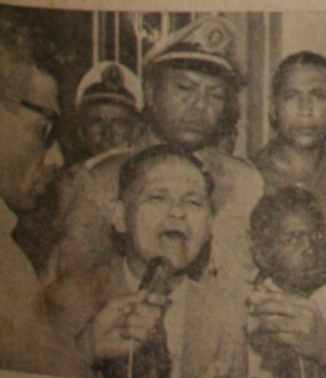
Seixas Dória falando aos ferroviários

Os trabalhadores da Leste Brasileiro, Central do Brasil, e outras estradas da Rede Ferroviária Federal, ontem pela manhã, significativa homenagem ao governador Seixas Dória, agradecendo a posição assumida pelo Governo do Estado a respeito do caso da ocupação das terras da Fazenda "Elea" no município de Pedrinhas neste Estado.