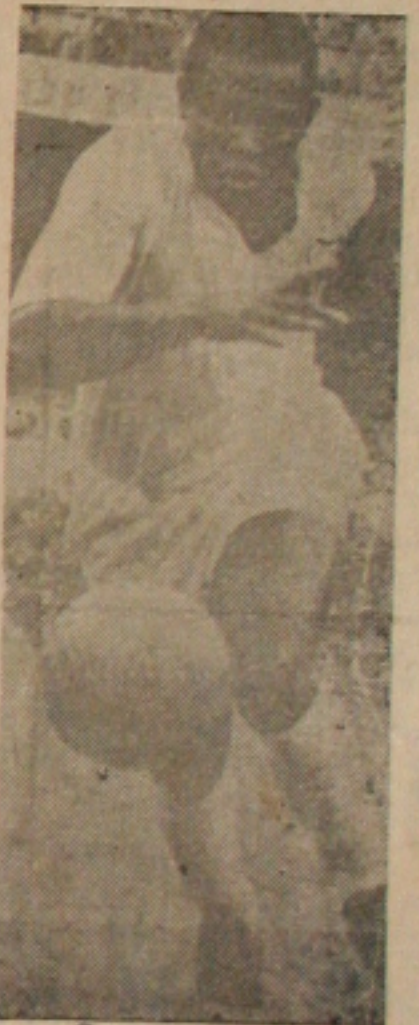
Coutinho, que junto com Pelé, tentará a famosa tabelinha para vazar o último reduto dos Gremistas

Já pelas bandas do quadro pelreiro, contará com todos os seus titulares inclusive a sua vedete Rei Pelé, já recuperado da contusão. O técnico Lula, que contará com todos os titulares, não tem problemas para escalar o quadro que enfrentará o campeão gaúcho, devendo ser a seguinte formação: Gilmar; Lima Mauro, Calvet e Geraldino, Zito e Mengalvio; Dorval Coutinho, Pelé e Pepe.