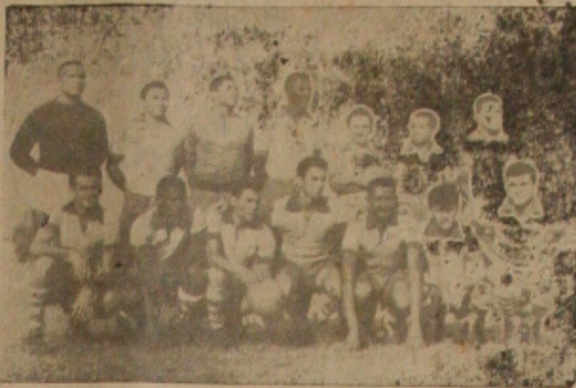
Este é o brioso time do Estanciano Esporte Clube, que luta bravamente para ingressar no regime profissional sergipano. Clube voga cnpá shrd

O estanciano se apresenta como teimoso. Briga para alcançar um lugar ao sol o que é negado pelos clubes que com-