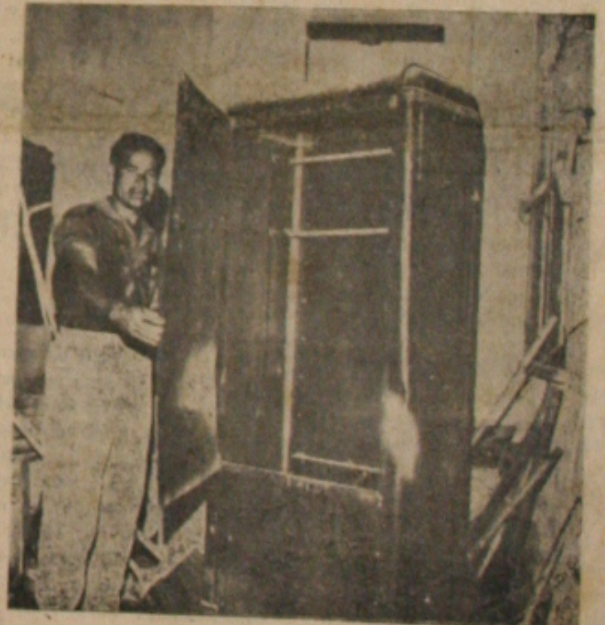
Esse armário vazio é chamado de Raio-X