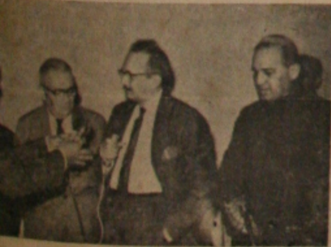
...da instalação do curso de alfabetização pelo ...do Paulo Freire

zação em massa, manteve entendimentos com autoridades do Estado sobre problemas atinentes à educação em Sergipe.