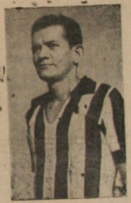
O artilheiro do Campeona- to que estará se exibindo hoje para os desportistas maruimenses