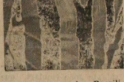
O quarto zaqueiro Brasil- no que retornará hoje a Penedo

RUBROS VAO REEDITAR Na cidade marechalina de Penedo, o Sergipe desta feita estará dando comoa- te ao Santa Cruz local e- quipe que ultimamente vem