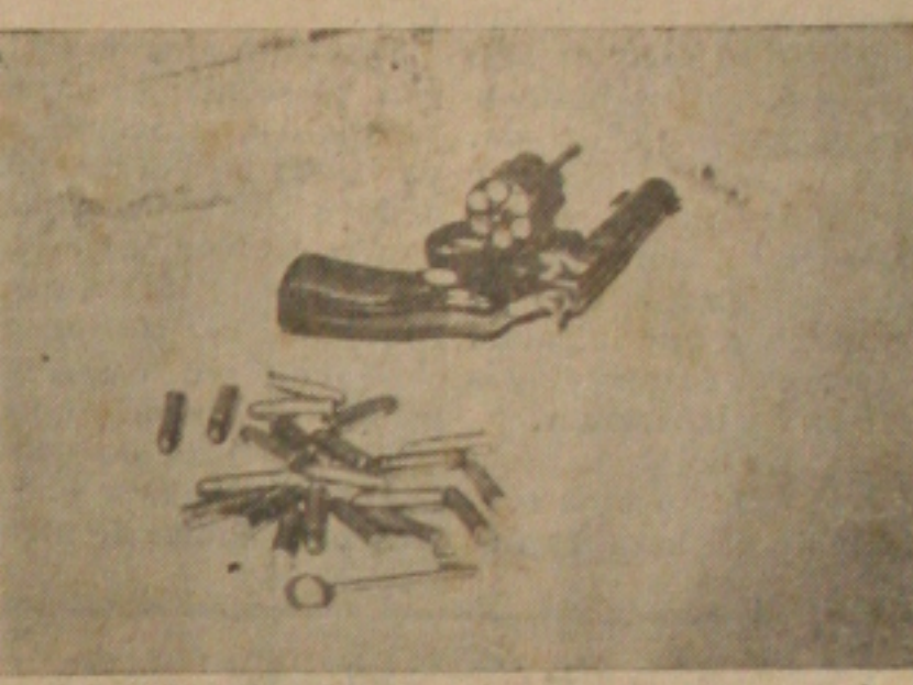
O Revólver de Modesto.

encontrava tranquilo e portava no momento do crime, um revólver com farta munição. Além desse revólver, foram encontradas outras armas na residência do referido indivíduo na Rua Porto Alegre, além de um parabeum de sete milímetros que ele negociou com um cidadão nesta Capital.