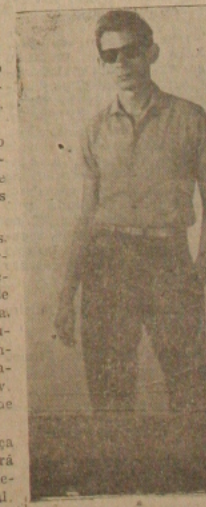
se entende. Ano novo, roupa nova Sercal.

Você é inteligente, faça as contas e comprová-las que ninguém mesmo oferece mais do que a Sercal. Grande desconto para as compras a vista mas na Sercal, você compra como quiser, conversando é que se entende. Ano novo, roupa nova Sercal.