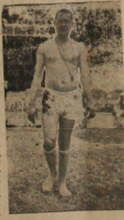
— A minha ida para o Ser- gipe só depende dos diri- gentes rubros...