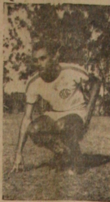
RUITER — Com dois tentos, salvou o Confiança da derrota.

Aos próximos jogos, conseqüentemente, caberá a palavra final, nas disputas em apreço.