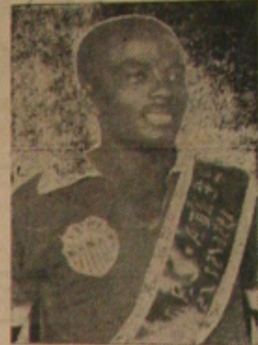
ABC — Um leão em campo (provou que idade não é documento).