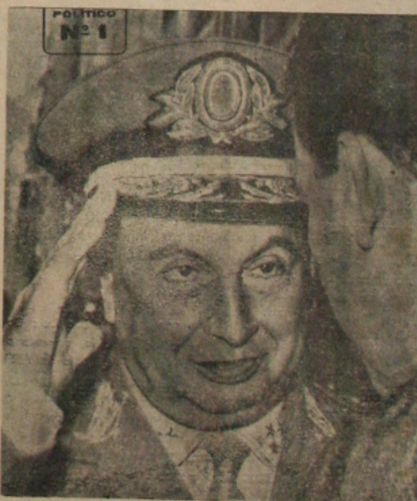
General Osvino Alves

Proseguindo, afirmou o Marechal Osvino Alves: