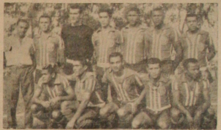
A representação super-campeã sergipana que se exhibirá domingo em Paulo Afonso