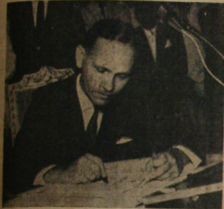
Governador sanciona a lei do aumento

Proseguindo na série de grandes pronunciamentos o governador Seixas Dória discursou ontem à tarde no "Olimpo Campos", por ocasião da sanção da lei que reajusta os vencimentos do funcionalismo estadual, definindo com clareza a linha do seu Governo.