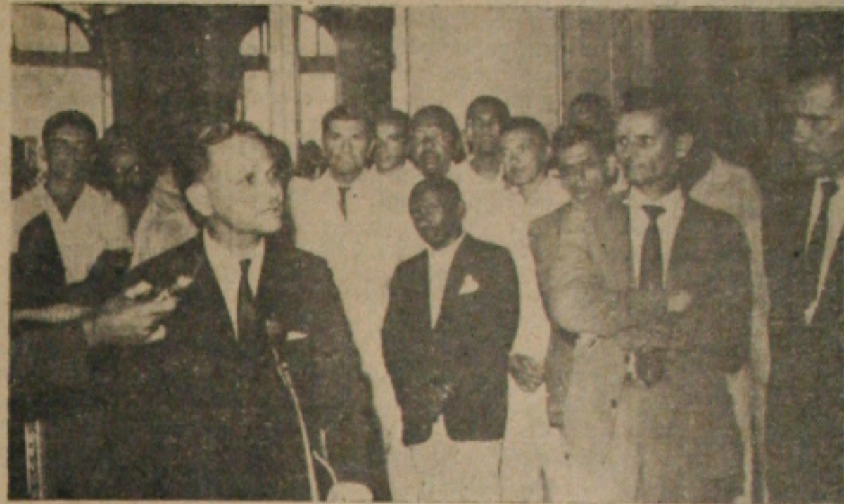
Seixas Falando aos funcionários estaduais