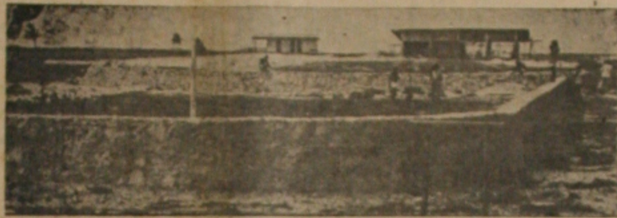
A foto ilustra aspecto da construção, vendo-se a churrascaria, ora em fase de acabamento