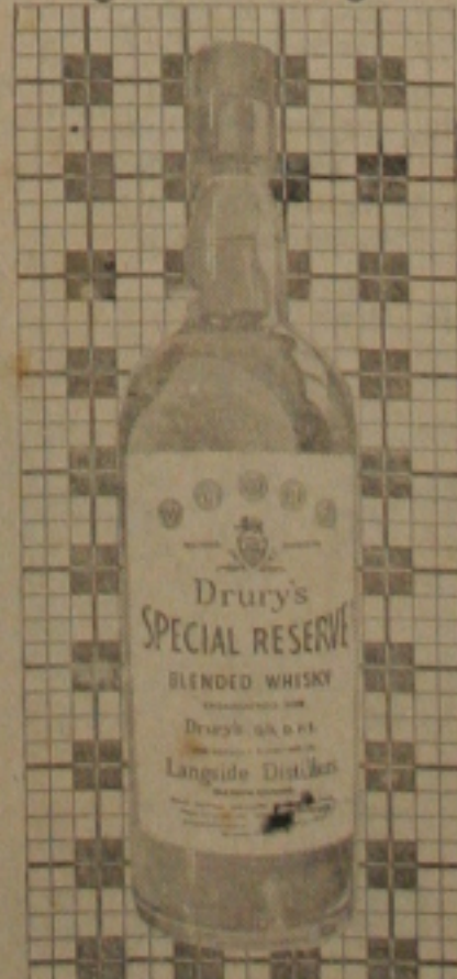
Carnaval com DRURY'S é outra coisa

Na Lavanderia Servebem, sua roupa é secada no SECADOR SENKING, moderna máquina que faz o trabalho de 8 horas de sol em 5 minutos, garante e não estraga a cor de sua roupa.