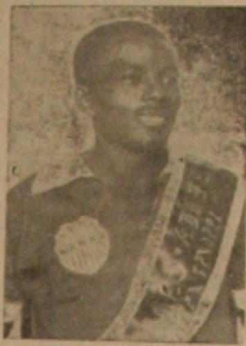
O veterano craque ABC, que espera melhor sorte no embate de domingo.

O prêmio mais importante da rodada final é o que cairá para Santa Cruz "versus" Cotinguiba, no Estádio da Vila Central, em Estância. Brigará o clube de Reptil Tênis por uma vitória ou até mesmo um empate, o que lhe dará a conquista da quarta vaga, vez que tem dois pontos a menos do que o seu próximo perseguidor, que é o Vasco. O cotejo se apresenta como de grande importância para os aracajuanos que terão de lutar contra um adversário que irá ao gramado ferido nos seus brios, muito