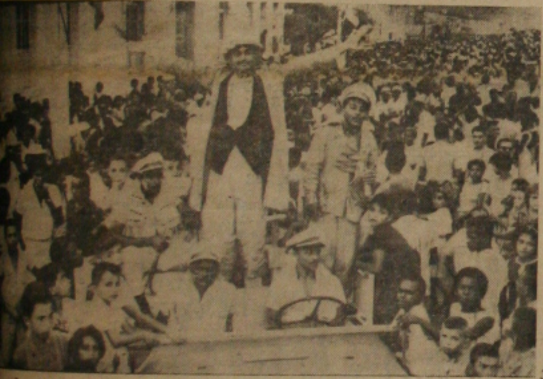
Rei Momo desfila pelas ruas de Aracaju

ORA o povo tenha presente a Praça Cardoso, nos três dias se comemoram os festejos carnavalescos, o carnaval sergipano pouca gente de atraente, a maioria dos clubes de nos-