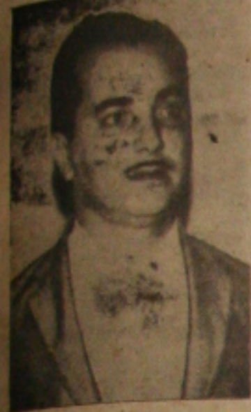
Prefeito Geraldo Maia

Ao encerrar no último sábado em Propriá, o I Seminário de Politização do S. Francisco, o Prefeito Geraldo Maia fiel a sua linha popular e nacionalista, realçou perante o povo propriense e grande número de pessoas de outros municípios do São Francisco, seu apoio as grandes lutas de transformação econômica do Estado e melhoramento das condições de vida da gente sergipense.