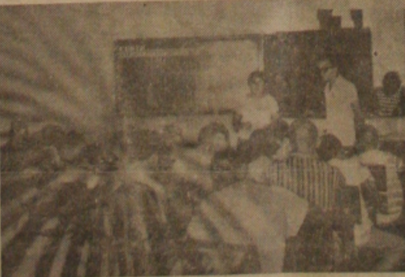
Reportagem sobre realização de provas para bolsas de estudos

Enquanto líderes estudantis lançavam notas de protestos contra o exorbitante aumento das anuidades escolares, promovido pelos diretores de estabelecimentos contrariando determinação do Ministério da Educação, a Inspeção Seccional fazia realizar ontem os exames de seleção dos candidatos a Bolsas de Estudos do MEC.