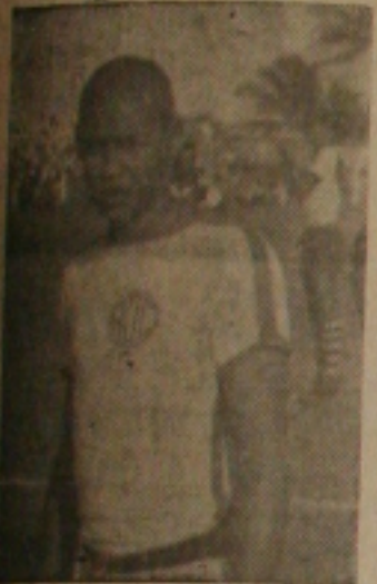
O eficiente zaqueiro proletário que durante 6 meses deixara de ser problema para o Confiança

"proletário" percebeu 50 mil cruzeiros de luvas e ordenado mensais de 30 mil cruzeiros, ficando o passe estipulado em 1 milhão e meio de cruzeiros.