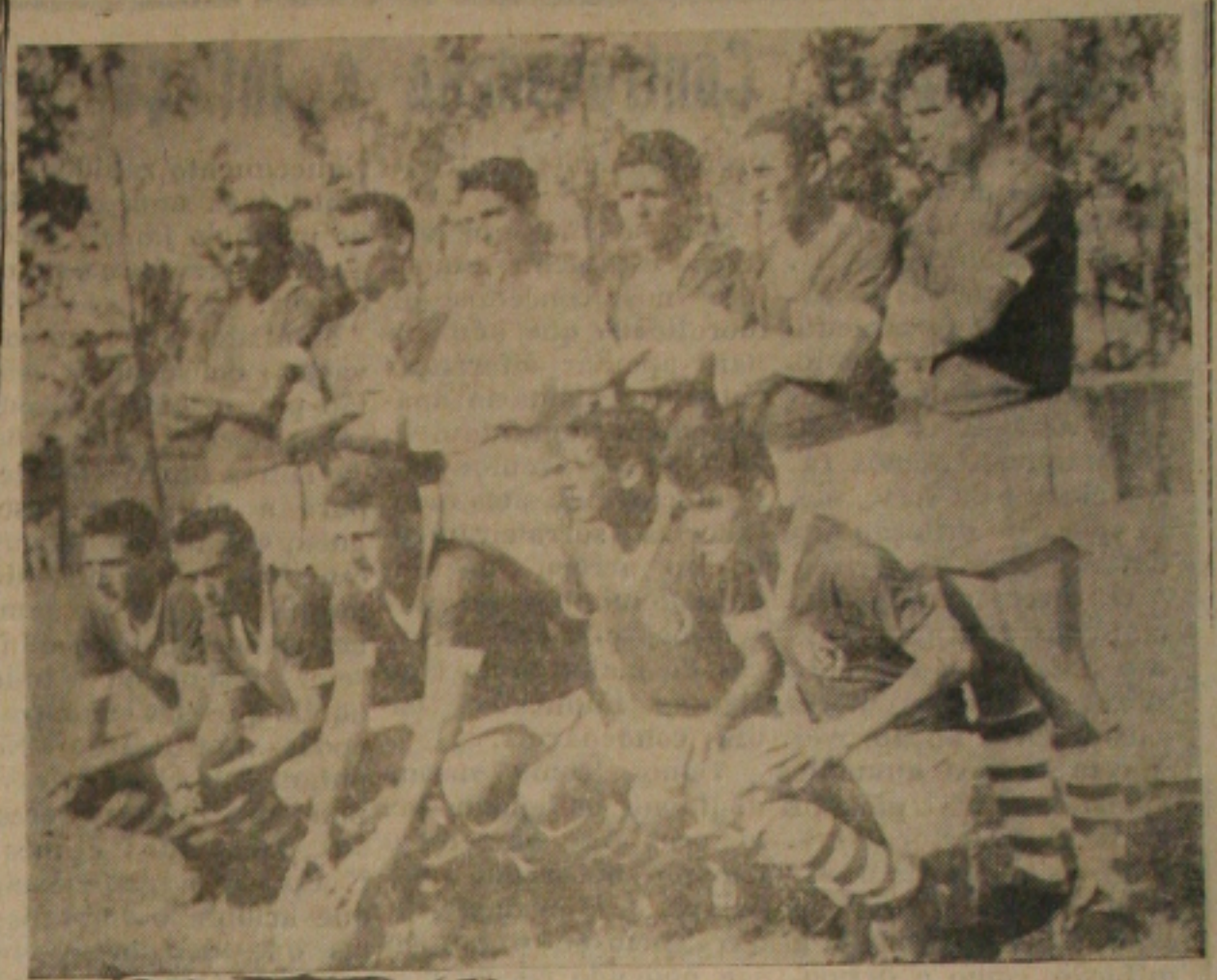
As representações do América de Recife e o Clube Esportivo Sergipe desta Capital, no segundo compromisso dos emeraldinos pernambucanos na presente temporada em nosso Estado.

Ao encerrar-se esta edição de GS, a situação era de calma em Belo Horizonte embora suas ruas estivessem fortemente policiadas.