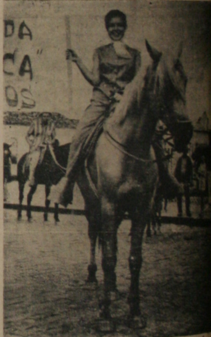
DA CAVALARIA. A jovem que hoje enfeita as nossas colunas, é uma das e quem sabe? Naturalmente jóias de mais alto valor que o seu reinado é um Logartem. Incrustada com cão, e nada mal do que a graça especial naquela cidade, ela esteve mais do que ter entre as mãos, foi formosa por ocasião da já famosa vaquejada. Montada num belíssimo cavalo, parecia Por hoje é só.

Seria interessante que todas as nossas jovens que estudam foto, pudessem enviar correspondência para a nossa