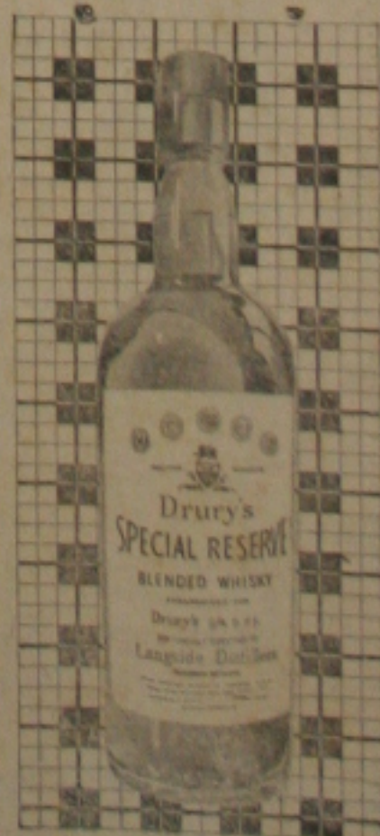
Bom mesmo é DRURY'S com água de 6600.