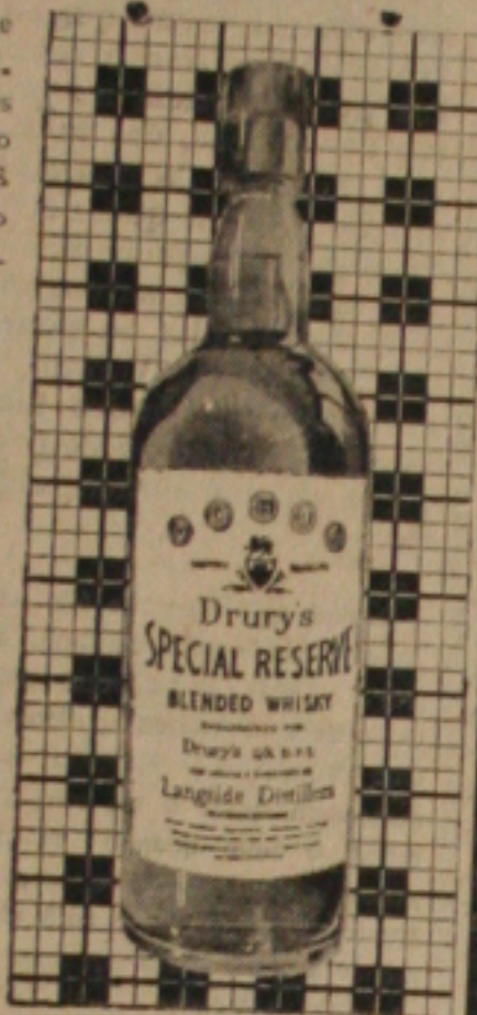
Bom mesmo é DRURY'S com água de côco.