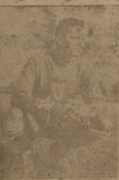
LIMA: PASSO LIVRE