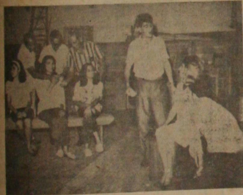
Cena de «A Prima Donna», do TECA