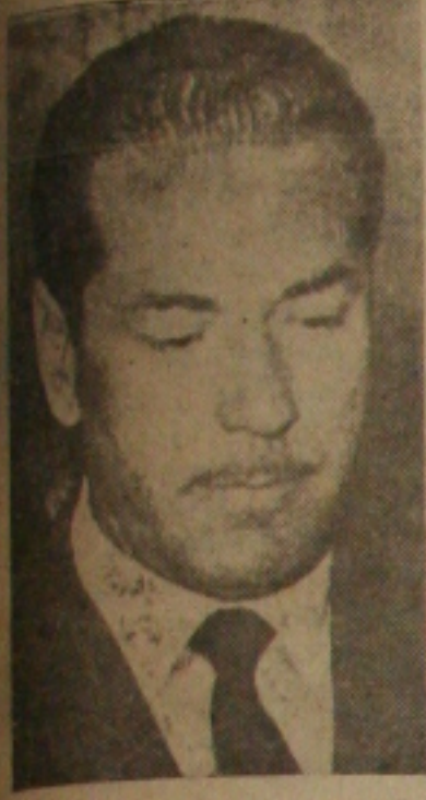
Deputado Leonel Brizola

BELO HORIZONTE 26 — Já está totalmente esclarecida a tentativa de agitação de um grupo reacionário mineiro chefiado pelo integralista Abel Rafael ontem nesta cidade, quando no auditorio da Secretaria de Saúde do Estado, falaram o líder Nacionalista Leonel Brizola e os Deputa-