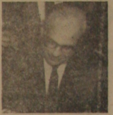
Otávio Bulhões, Ministro da Fazenda

Acentou ainda que as autoridades fazendárias pretendem dinamizar as arrecadações no País, depois de afirmar que país algum consegue desenvolvimento satisfatório, sem primeiro estabilizar a moeda.