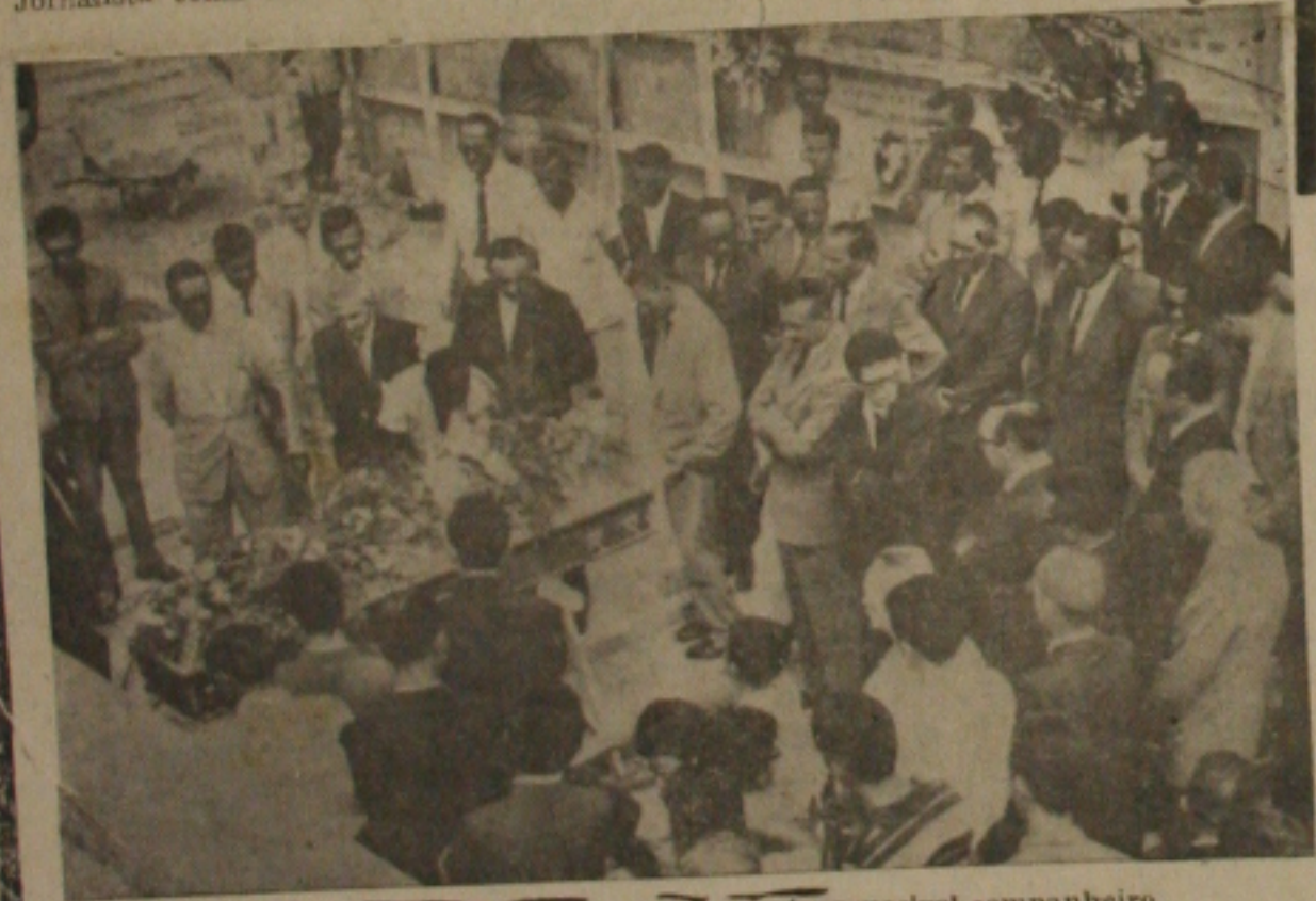
Aspecto do sepultamento do nosso inesquecível companheiro