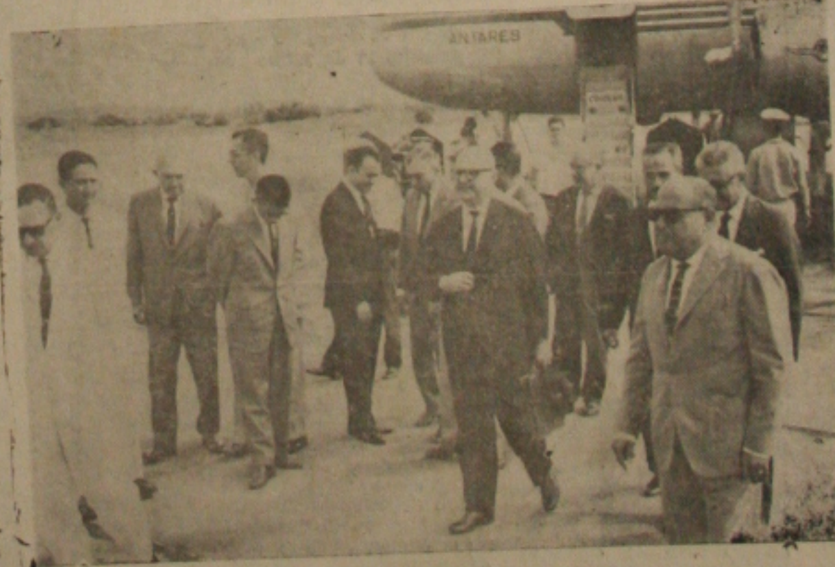
Au'idades desembarcaram no Aeroporto Santa Maria: vão assistir inauguração do Banco, hoje

Visando ajudar aos leitores, Conclua na 6.ª Página