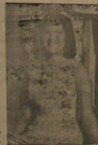
Isabel, Miss — B 3

As 15.00 horas Isabel receberá o título de "Cidadã Aracajuana", dado pela Câmara dos Vereadores.