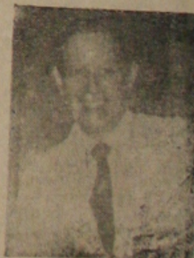
Vasco Leitão da Cunha

to difícil para a vida das Américas, o Brasil mais do que nunca, está animado no desejo de ver defendidos e segurados os grandes princípios que inspiram a vida em caminho dos signatários da Carta de Bogotá.