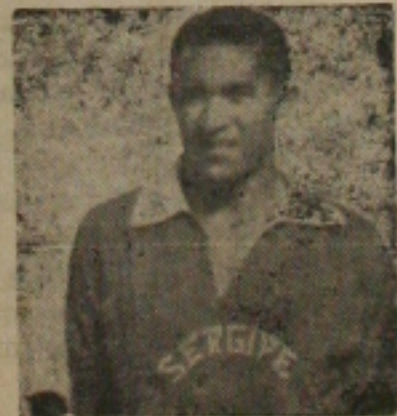
Jorgeva, não seguirá com a delegação em virtude de ter extraído uma unha.

gipana, quando o seu vice-presidente assumiu, em certo discurso anônimo de um político a seguinte frase: "estou satisfeito, porque agora temos um dos nossos na Federação Sergipana de Desportos". Colossais palmas surgiram na oportunidade por um grupo de políticos convidados através de ofícios para assistirem o acontecimento.