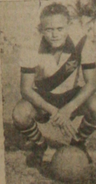
O crack cruzmaltino foi ao interior baiano e já confirmou sua qualidade de artilheiro

mesmo perdendo na estreia, ante a esquadra do Colo-Colo de Ilhéus, que apresentou-se de maneira brilhante derrotando o quadro Sergipano, que o despeito de derrotado ofereceu resistência e praticou boa exibição de futebol "association". Maiores detalhes daremos oportunamente.