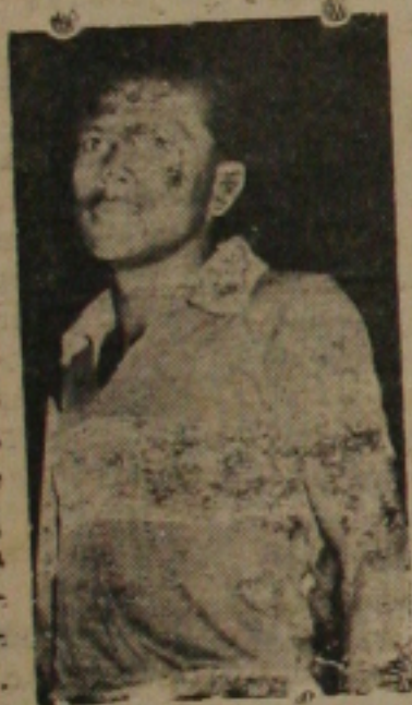
Tarati, agora deslocado para a azia media esquerda, estará domingo travando sensacional duelo contra os Irmãos Barros.

Noticias chegadas da Princesa do Piauíntinga adiantam que existe possibilidades do grêmio pentacampeão do Estado para ali seguir na tarde do próximo sábado em carros especiais indo de véspera devido ao péssimo estado da estrada de rodagem.