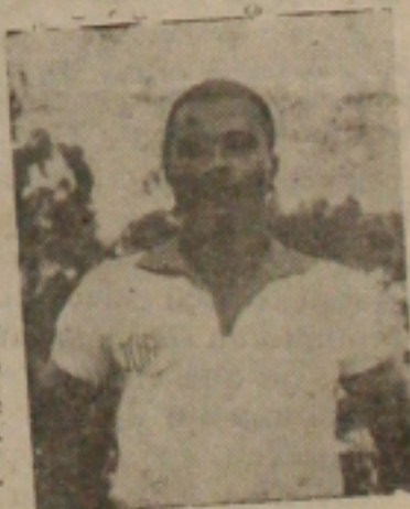
O valente zagueiro central Zarzir que em contato com a «GS-Esportiva» demonstrou desejo de lua em troca pela classificação.

Desprezado pelo Vasco, raramente acontecendo, o mesmo Zarzir foi encontrar um técnico levando para o pouso certo nas bandas do vizinho Estado, a esperança de conquistar para a família do "Dragão do Bairro Industrial" — acrescentou — a vitória tão esperada por todos. Encerrando nossa rápida palestra o vigoroso atleta bi-super-campeão sergipano afirmou que é chegada a hora de jogar seriamente não somente pela responsabilidade que tem pela frente, como ainda devido a aproximação do encerramento do seu contrato, uma vez que não deseja desemprego.