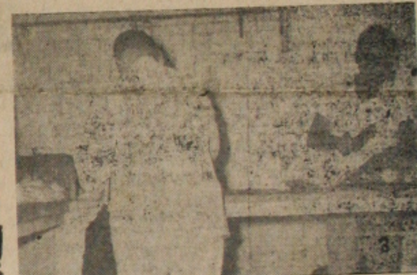
3 - TALHOS VAZIOS — Pois é amigos, ontem foi nessa base: carne que é bom não apareceu. A do Frigorifico não deu para quem quis. Será que hoje vai haver carne?

Na foto, o novo diretor da Superintendencia do Desenvolvimento do Nordeste.