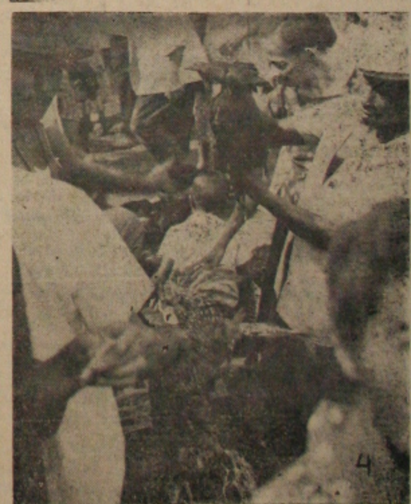
4 - GALINHAS, GALINHAS — Pois bem, ontem apareceram as galinhas. Depois de mais de sete dias de ausência teve, mas não teve pra todo mundo, não. Aguardamos, otimistas, que o abastecimento das galinhas seja verdade, nos proximos dias.