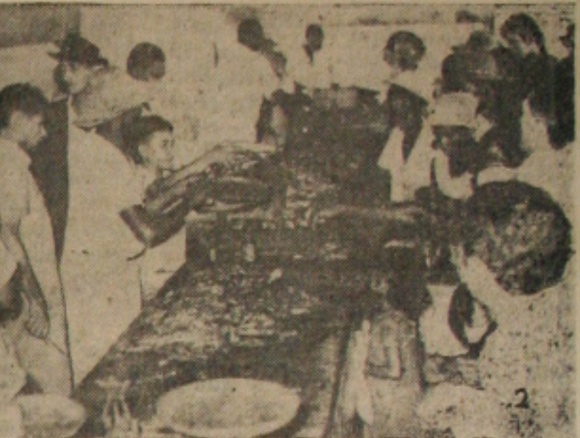
2 - «ENGASGA GATO» — Os peixes popularmente conhecidos por «engasga gato» salvaram muitas mesas da falta total de comida. Embora caro, as suas bancas receberam muitos visitantes.

A investigação está sendo feita, porque se Lacerda não contasse com cobertura, obviamente estaria caído. Sabese a par destas investigações, o Conselho de Segurança Nacional estuda medidas para serem postas em prática, caso Lacerda tente agitar o país. Jornais conservadores, mas que são contrários a Lacerda, anunciam que caso seja necessário poderá haver até intervenção na Guanabara.