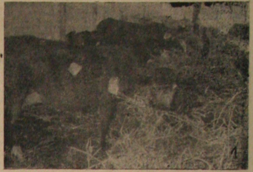
1 - VACAS MAGRAS, RAÇOS CARAS — apesar das chuvas. Sem comentários.

duvida, manobras dos especuladores que não se contentaram com as «furturas», desde cinco anos. Nesse caso o tabelamento rigoroso se impõe, como medida certa e oportuna. Mas, ontem a carne verde era escassa. O povo, especialmente as donas de casas voltaram desalentadas.