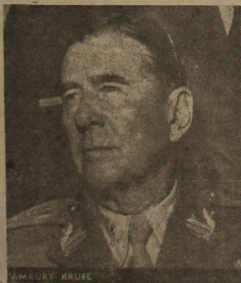
RIO 3 — FORTES do Ministério da Guerra desmentiram a saída do General Amaury Kruel do Comando do Segundo Exército. Declararam que o General Kruel continua prestigiado pelo Ministro da

Guerra é principalmente pelo Presidente Castelo Branco. Os mesmos informantes confirmam a ida do General Justino Alves Bastos para o comando do Terceiro Exército, com sede em Porto Alegre.