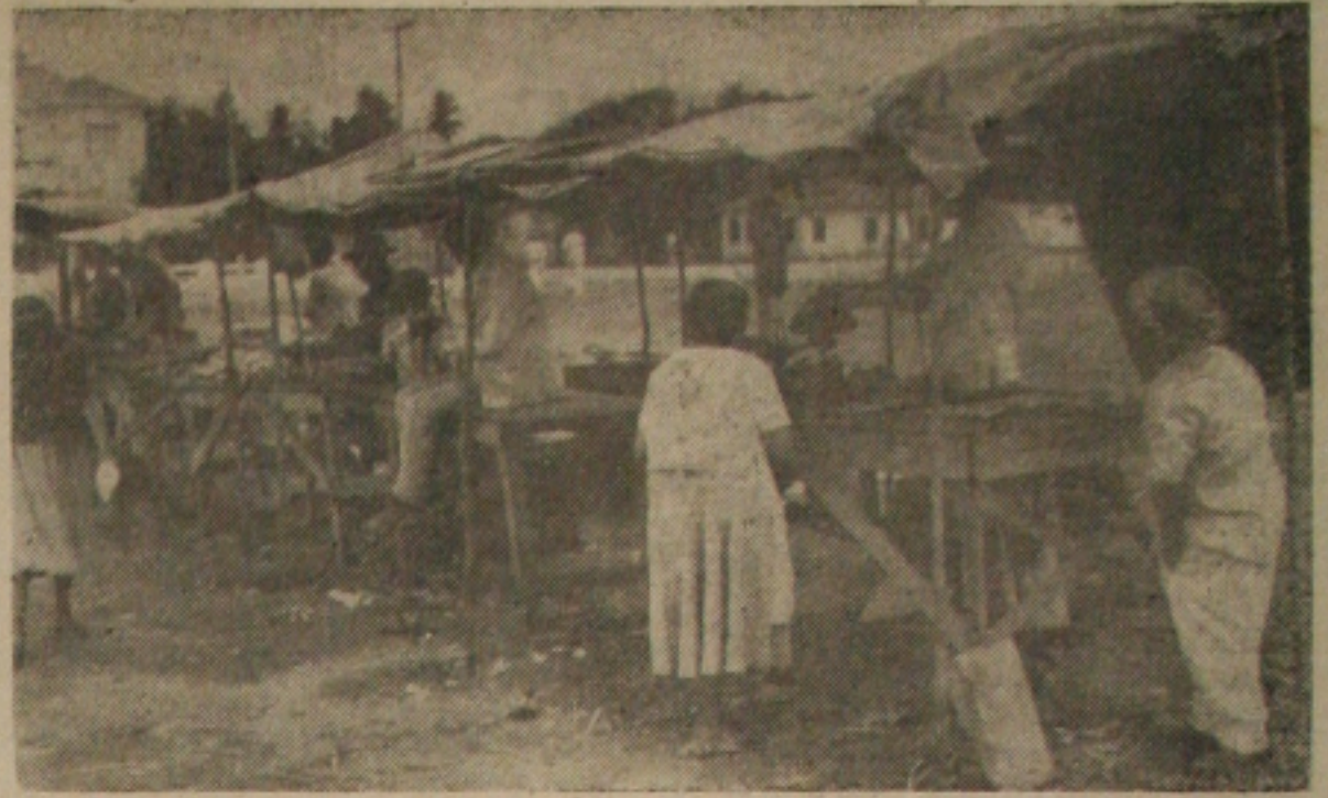
Nas diversas feiras da cidade neste fim de semana o pano ama foi o mesmo: carne, que é bom, nécas