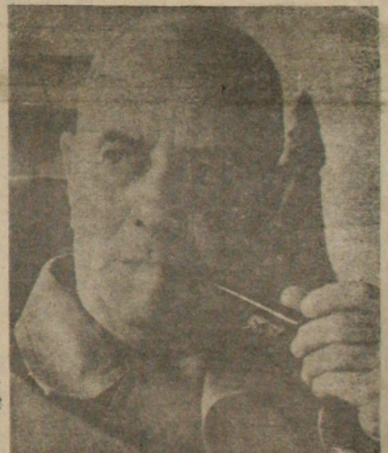
RIO 3. O general Olímpio Mourão Filho, recentemente nomeado comandante do IV Exército, sediado em Recife, acaba de embarcar para assumir o posto. A presença do general Mourão Filho no Nordeste indica que a sua conduta político-militar continuará a seguir a linha de tolerância e equilíbrio que marcou seu comando na IV Região Militar, em Minas Gerais.

mesmo o trecho calçado interditada, sendo que os funerais são feitos pelo Bairro América, em cuja estradas se encontram grande possas d'água.