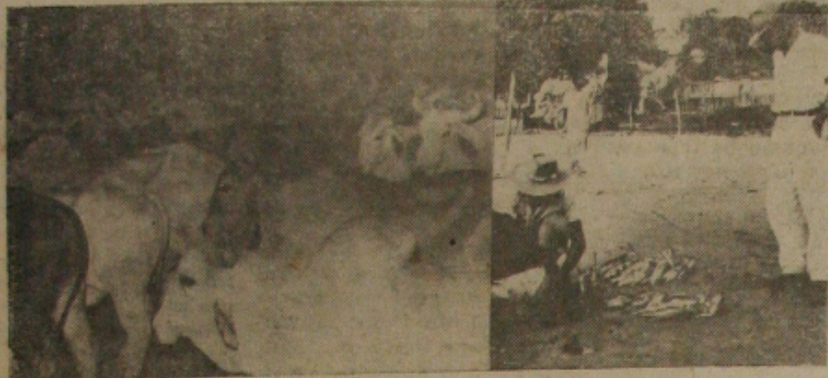
Enquanto boiadas vão embora do Estado, o povo sente falta de carne. E os peixes apareceram tão pouco, que foi difícil fotografar o "montinho" que aparece no clichê

Acentuou-se ontem a falta de carne de boi nas bancas, o mesmo acontecendo com o peixe e galinhas. Na Bahia, o governador Lomanto Junior autorizou a compra da arroba do boi a quatro mil cruzeiros forçando a baixa nas bancas distribuidoras.