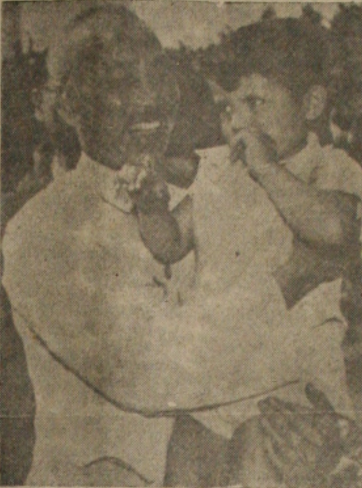
Ho Chi Minh, Presidente do Vietnam do Norte

Mac Namara insistiu, entretanto, num ponto: «Não havia centros de população