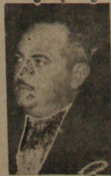
Governador Celso de Carvalho

setores especializados de abnegrafia, raios-x, assistência dentária, vacinação e — possivelmente — a assistência odontológica volante.