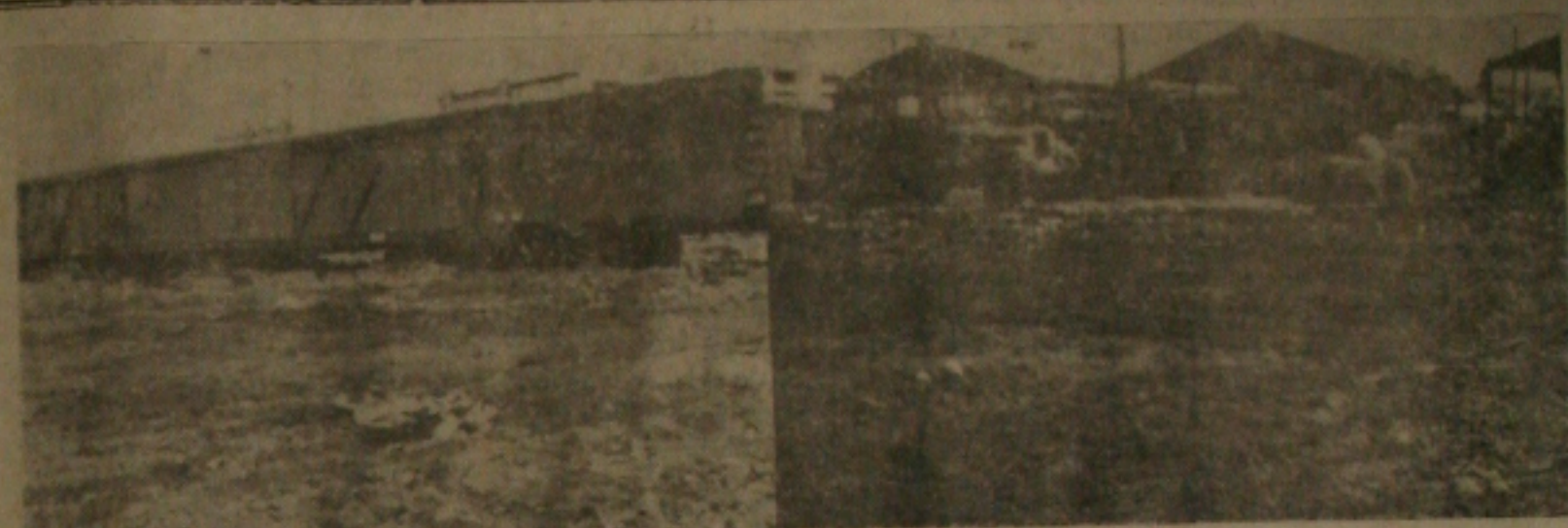
NESTA época de inverno, tudo é lama pelas bandas do Mercado Municipal.

Enquanto as autoridades educacionais recebiam comunicação das várias escolas caídas no interior do Estado, o Secretário de Educação nos informava que o Governo estava providenciando gestões no sentido de conseguir meios financeiros, através do Governo Federal e junto à Sudene, na tentativa de atender aos justos reclamos das populações de municípios da chamada zona rural e do próprio ensino primário.