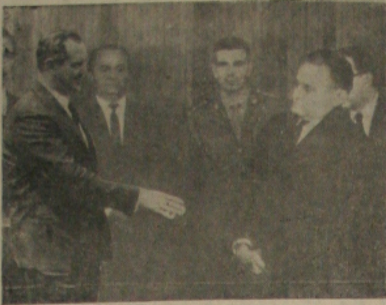
Castelo — Lomanto

SALVADOR 7 — O Presidente da República almoçou hoje com o Governador Lomanto Jr., estando presentes na capital baiana, os governadores de Pernambuco, Alagoas e Sergipe do Superintendente da SUDENE e do Comandante do Quarto Exército. O avião do Chefe do Executivo aterrou em Salvador às 10,40 minutos, tendo o presidente desfilado em carro aberto no percurso do aeroporto até o Palácio da Aclamação. Na sacada do Palácio o Presidente da República recebeu homenagens de duas mil pessoas.