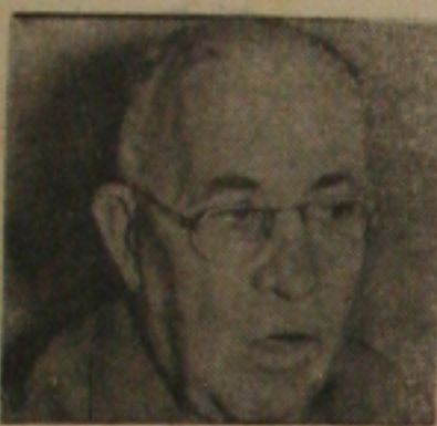
Ildo Meneghetti, Governador do Rio Grande do Sul

Ildo Meneghetti foi bastante visitado durante todo o dia de hoje em seu apartamento do "Hotel Serrador", onde se encontra hospedado. Entre os que estiveram com o primeiro mandatário do Rio Grande do Sul, destacou-se o Ministro da Indústria e Comércio, Daniel Fagaro.