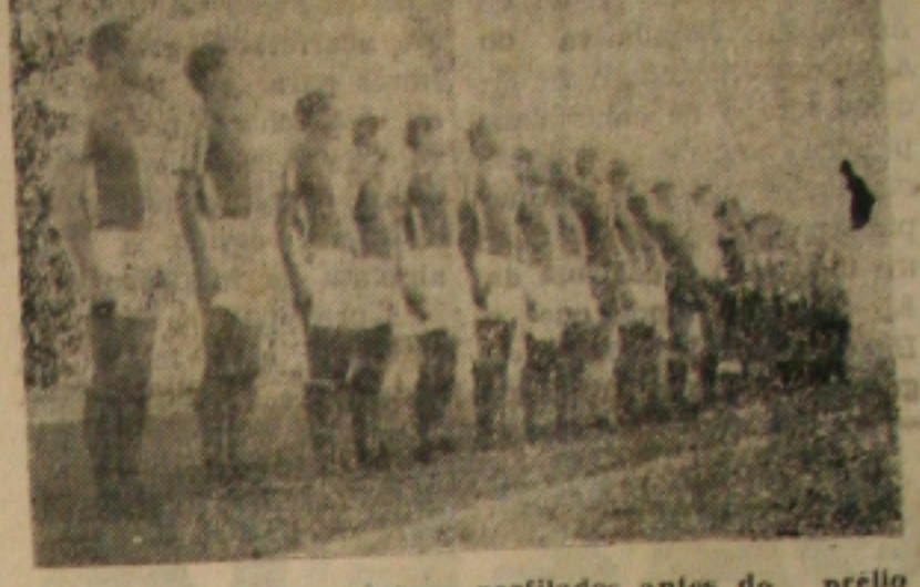
Confiança e Campinense perfilados antes do prelo que mais tarde trazia a grande satisfação para a torcida sergipana.