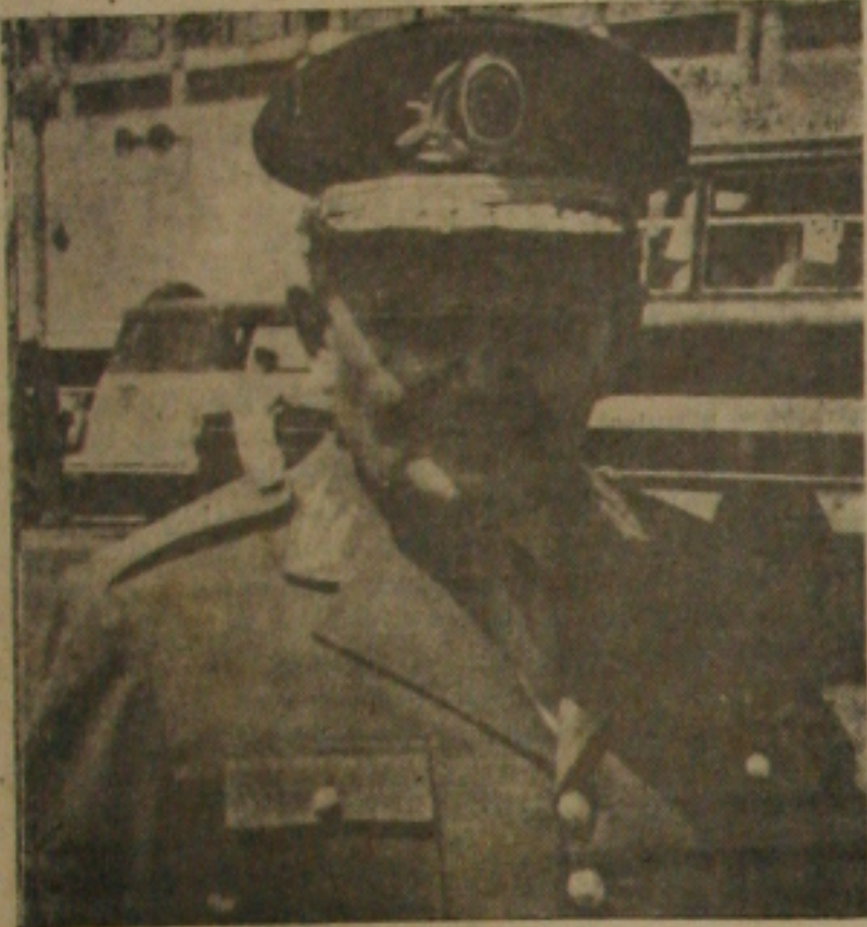
Presidente Castelo Branco