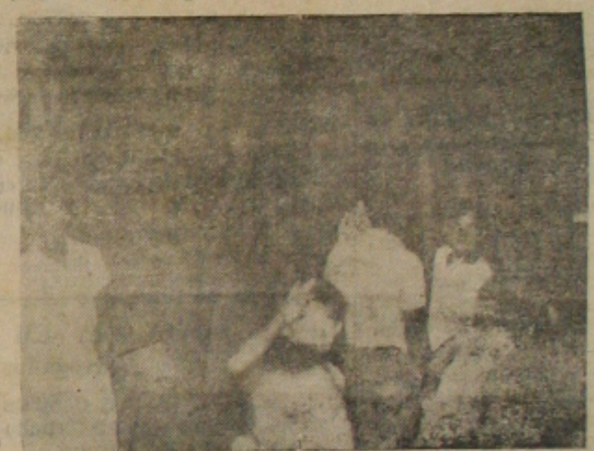
Aspecto da colisão de ontem