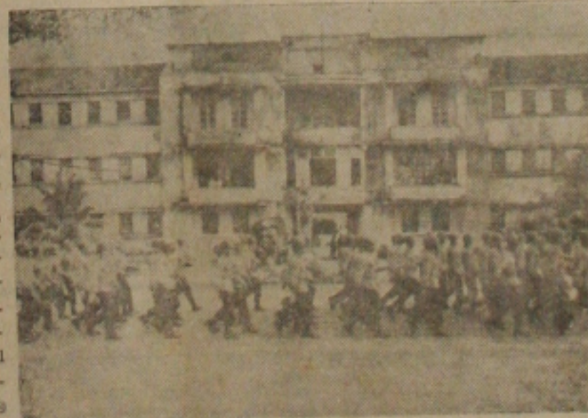
O desfile Militar

O comando do 28.º B.C. fez distribuir bebidas e doces, logo após as comemorações.