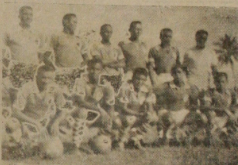
Na foto vê-se o quadro do Santa Cruz, campeão do primeiro turno da Taça Brasil, que domingo concederá revanche ao Ferroviário.

sibilidade de agradar os torcedores locais.