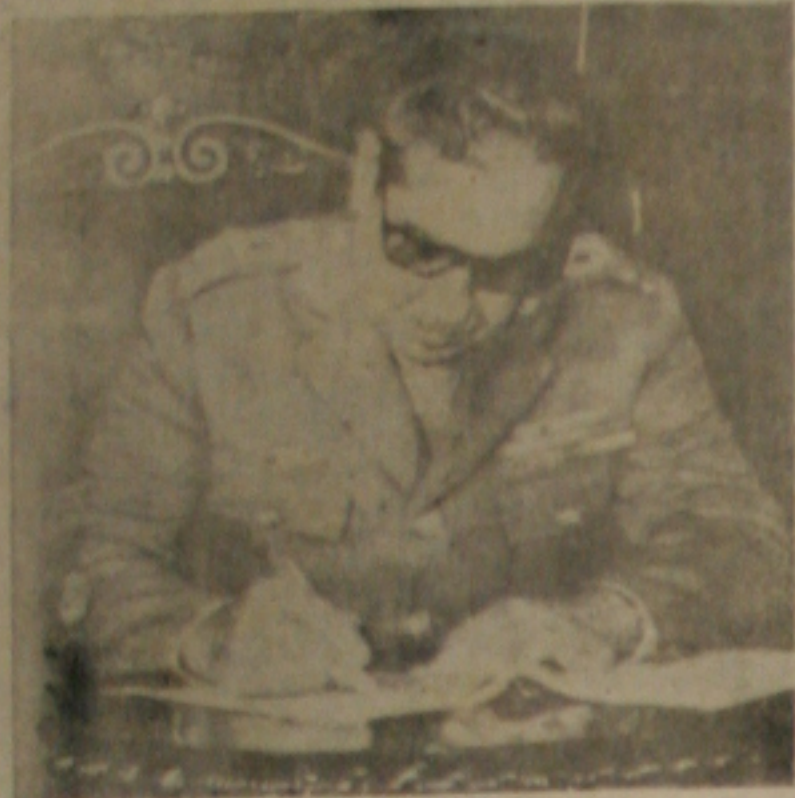
General Costa e Silva

RIO — 27 — O Ministro da Guerra General Artur Costa e Silva, distribuiu à imprensa nota sobre o manifesto do Ex-Presidente João Goulart, que foi lido na Ca-